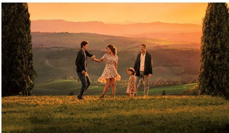
„Włoskie wakacje” rez. James D’Arcy